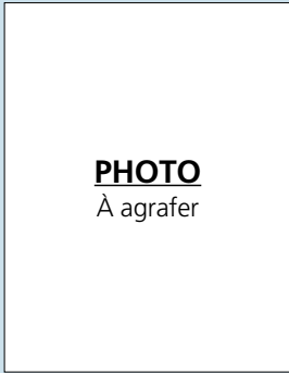
PHOTO À agraffer